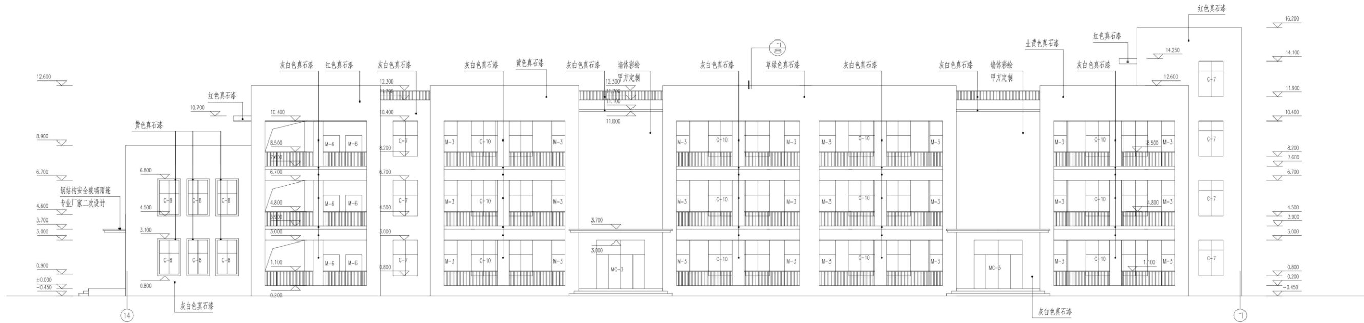
14-1 立面图 1:100